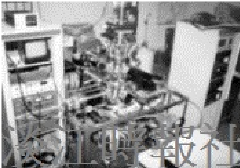
物理系實驗器材真空鎗 ( LEED, RHEED, CMA )