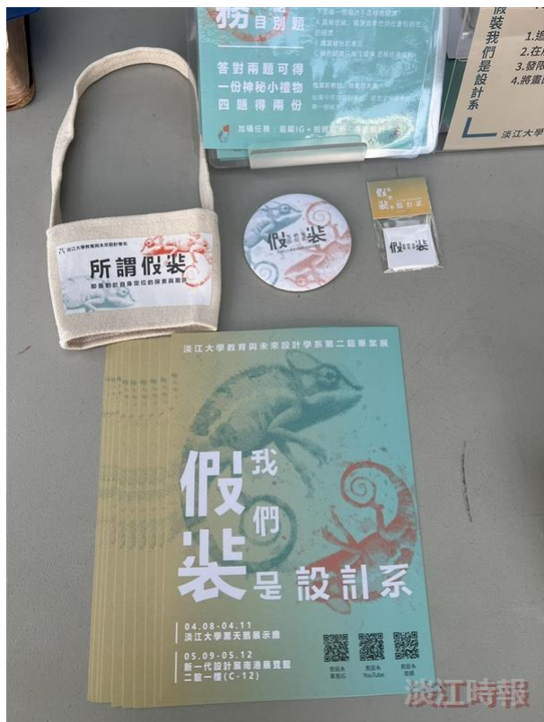
展場一隅。