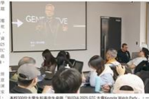
淡江大學學生與台大學長黃仁勳在GTC 2025主題Party中，共同探討AI趨勢。

【淡江訊】淡江大學與台灣大學共同主辦的「GTC 2025 主題Party」日前在淡江大學舉行。活動吸引了超過300名學生參加，共同探討AI趨勢。淡江大學校長黃仁勳在致詞時表示，AI是未來社會的重要驅動力，學生應積極學習相關知識，以因應未來的挑戰。活動中，多位專家學者分享了AI在各領域的應用與發展趨勢，並與學生進行了互動交流。