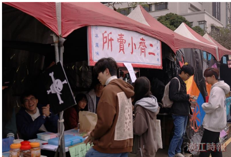
各校友會攤位販售地方特色美食，吸引不少人潮前來品嚐。