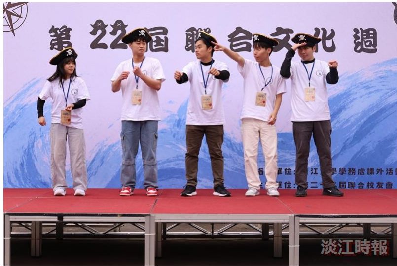
第22屆聯合文化週開幕式，各校友會幹部帶來短劇表演。