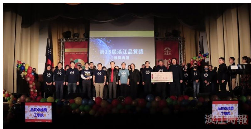
工學院獲得第15屆淡江品質獎「品質卓越獎」。