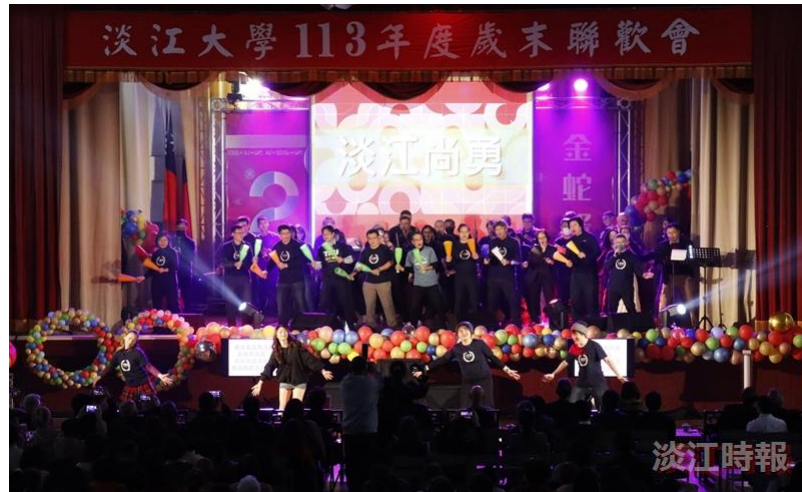
工學院團隊帶來快閃熱舞「淡江尚勇」，點燃熱烈氣氛。