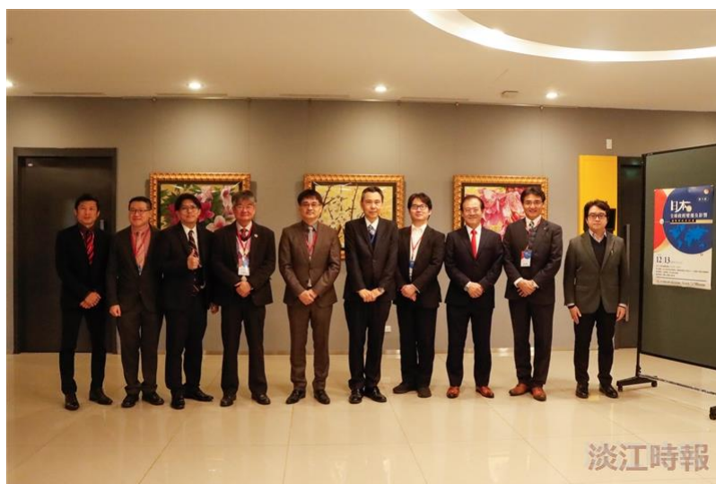
與會貴賓合影。