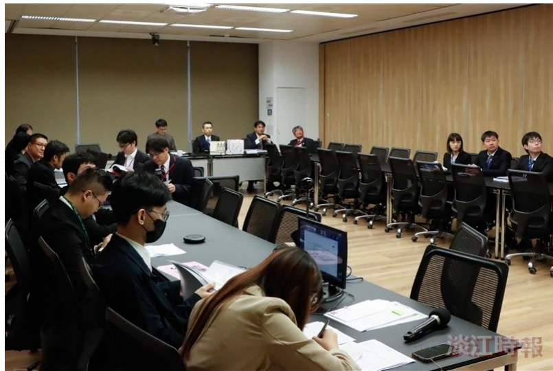
日本與全球政經變遷及影響