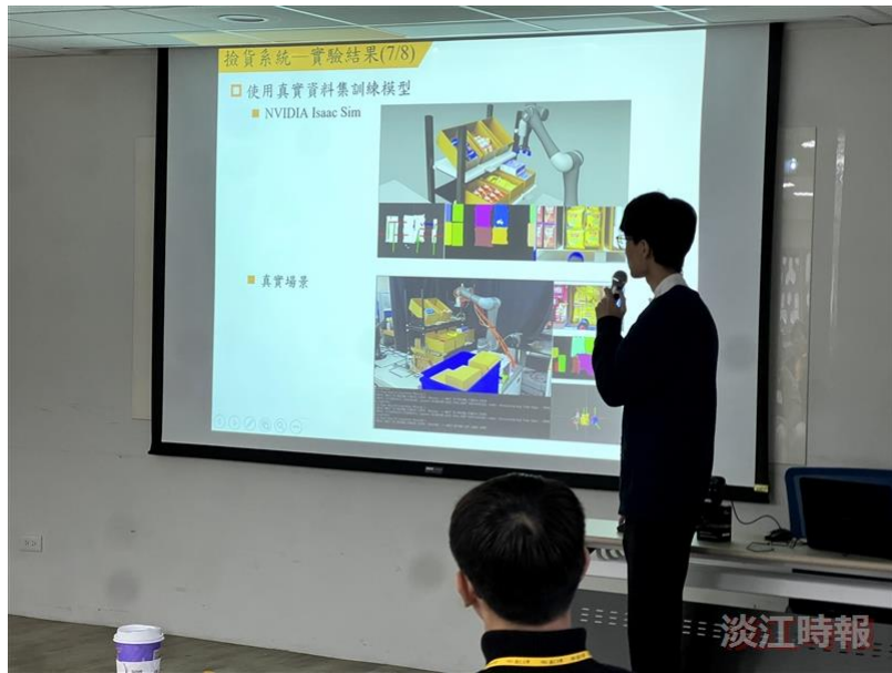
電機週兩大賽雙料冠軍「基於數位孿生之物流工作站」，於電子電機系友論壇中解說成果。