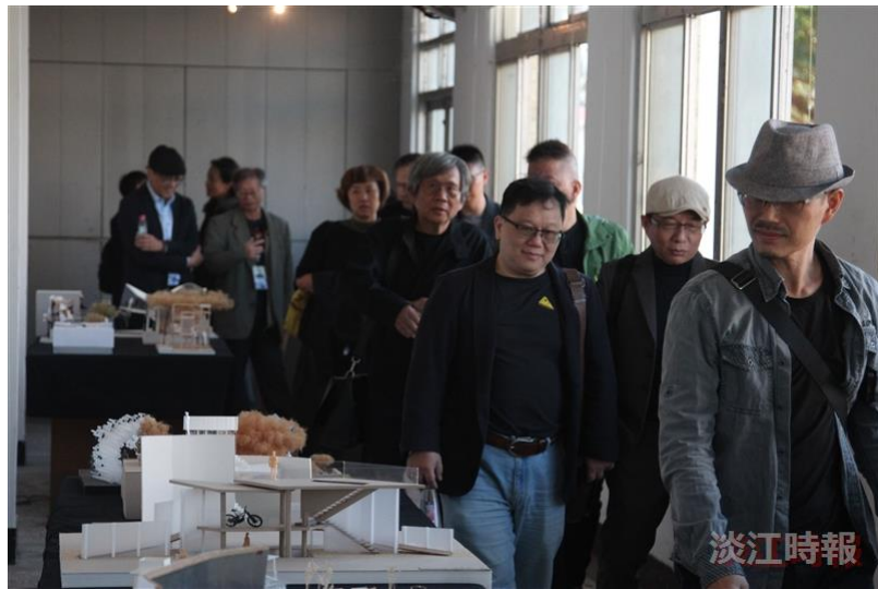
逾百建築系友返校慶60週年。