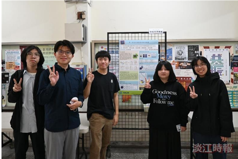
「快使用單傑棍」成員於「毫米波雷達AI創意競賽」展示成果。