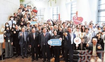
2009年徐旭東名譽博士授與典禮，由淡江大學校長主持，徐旭東獲頒名譽博士學位證書。

淡江大學與遠東大學攜手合作，共同締造教育佳績。兩校在教學、科研、交流等方面展開了廣泛合作，促進了兩校的發展。此次合作是兩校友好關係的進一步發展，也是兩校共同推動教育事業發展的體現。