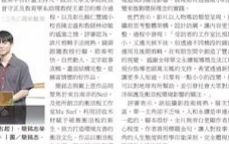
淡江大學三名學生在頒獎典禮上獲獎。

【本報專訊】由「第八屆全球華文永續報導短片」主辦的「第八屆全球華文永續報導短片」頒獎典禮，日前在台北舉行。淡江大學的三名學生獲獎。獲獎學生表示，他們的短片《永續報導》記錄了他們在淡江大學的學習生活，展現了淡江大學的永續發展理念。他們的短片在評審團中獲得高度評價，認為其內容充實，拍攝手法精湛。獲獎學生表示，他們非常榮幸能獲得這項殊榮，並將繼續努力，為社會做出更多貢獻。頒獎典禮現場還展示了多件獲獎作品，吸引了眾多觀眾參與。主辦單位表示，未來將繼續舉辦類似的活動，推廣永續報導的發展。