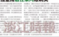
建築系學生在頒獎典禮上獲獎。

【本報專訊】由「臺南最佳築角」主辦的「臺南最佳築角」頒獎典禮，日前在台南舉行。淡江大學建築系的三名學生獲獎。獲獎學生表示，他們的設計方案《創意營造社區》展現了他們的創意與設計能力。他們的設計方案在評審團中獲得高度評價，認為其設計理念先進，方案可實施。獲獎學生表示，他們非常榮幸能獲得這項殊榮，並將繼續努力，為社會做出更多貢獻。頒獎典禮現場還展示了多件獲獎設計方案，吸引了眾多觀眾參與。主辦單位表示，未來將繼續舉辦類似的活動，推廣建築設計的發展。