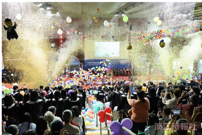
畢典在彩炮聲、繽紛紙花及滿空氣球下，伴隨著依依不捨的氣氛畫下圓滿句點。