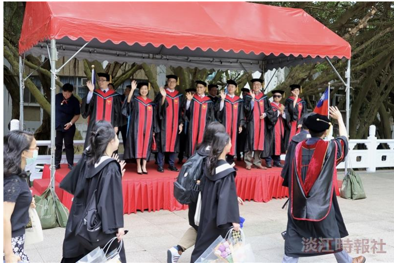
畢業典禮前，葛校長和師長們在觀禮臺上歡迎畢業學子。