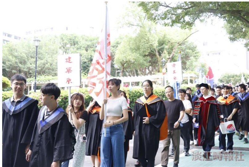
畢業典禮前，由系主任帶領畢業生進行校園巡禮。