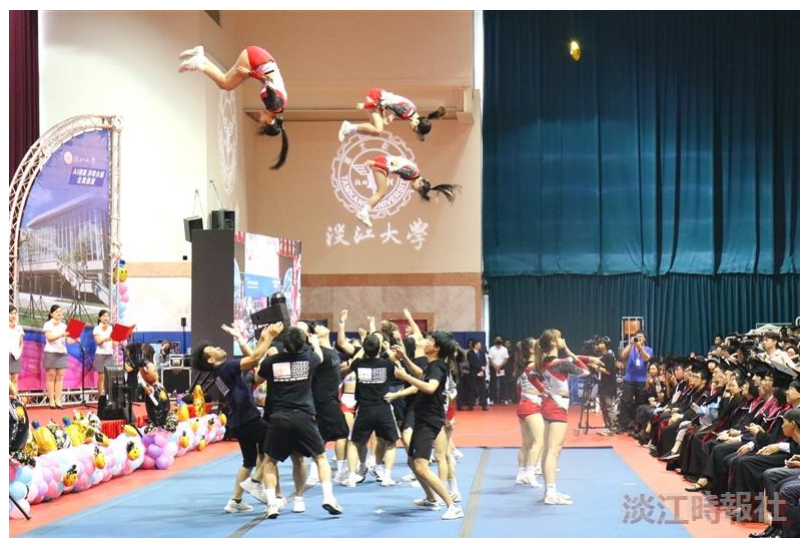
畢業典禮由競技啦啦隊精采的表演揭開序幕。