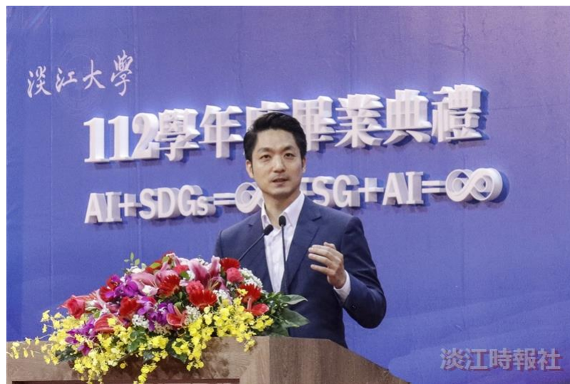
臺北市市長蔣萬安以自身經歷勉勵畢業生。