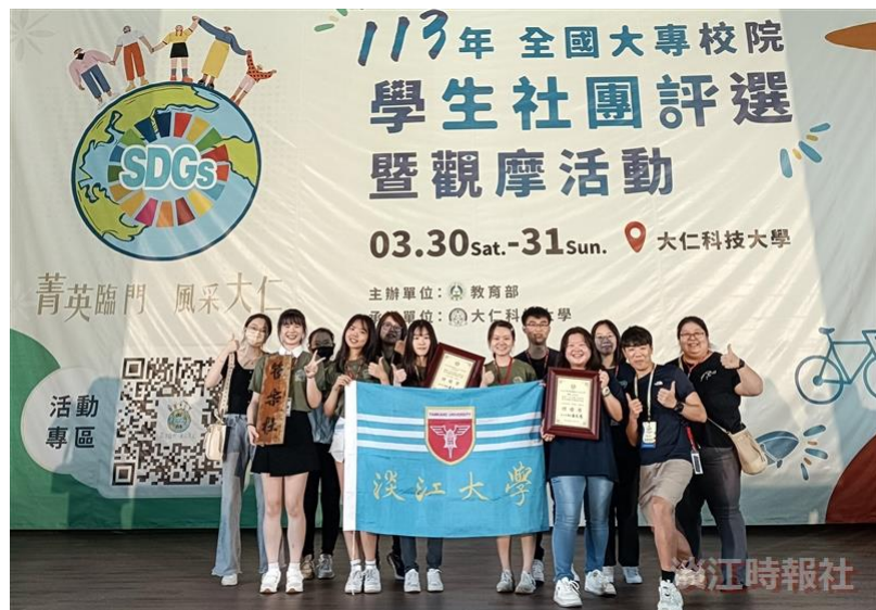
機器人研究社及管樂社參加全國大專校院學生社團評選，獲得雙特優，大家開心合影。