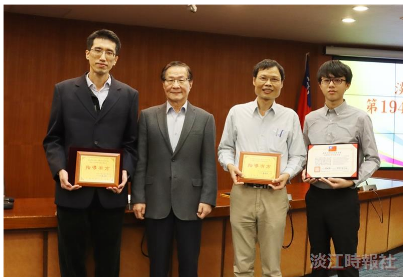
葛校長（左2）於頒獎後，與國科會111年度大專學生研究計畫「研究創作獎」的學生及指導教師合影。