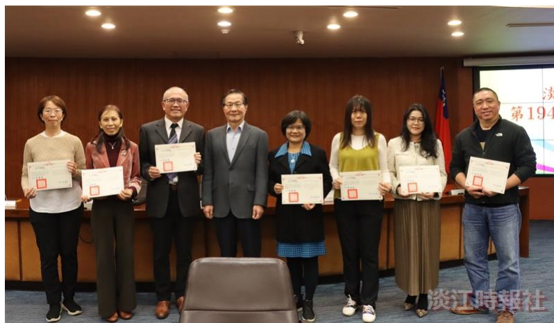
葛校長（左4）於頒獎後，與112學年度「社會實踐服務」特優教師及優良教師合影。