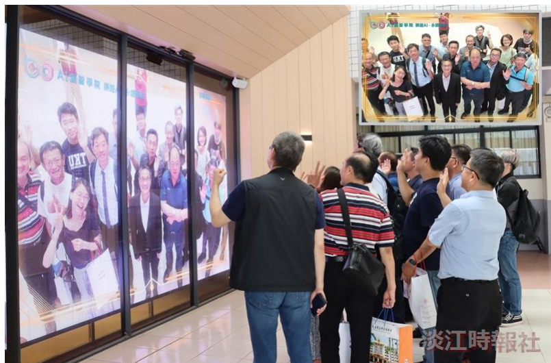
道明高中教職員參觀AI創智學院實境場域，體驗AI智慧互動牆拍攝大合照。（攝影／鄧晴，右上合照成品／AI創智學院提供）