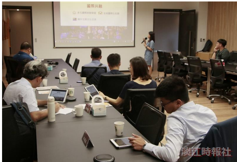
道明高中教職員聽取國際處簡報，了解本校國際交流現況。