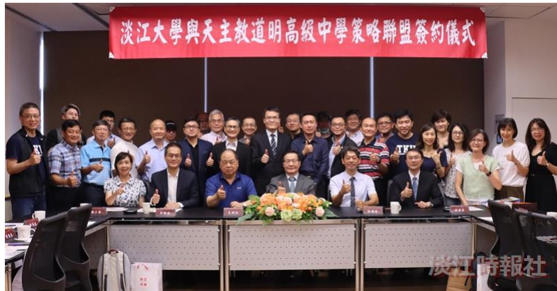
本校與高雄市天主教道明高級中學簽訂策略聯盟。（攝影／鄧晴）