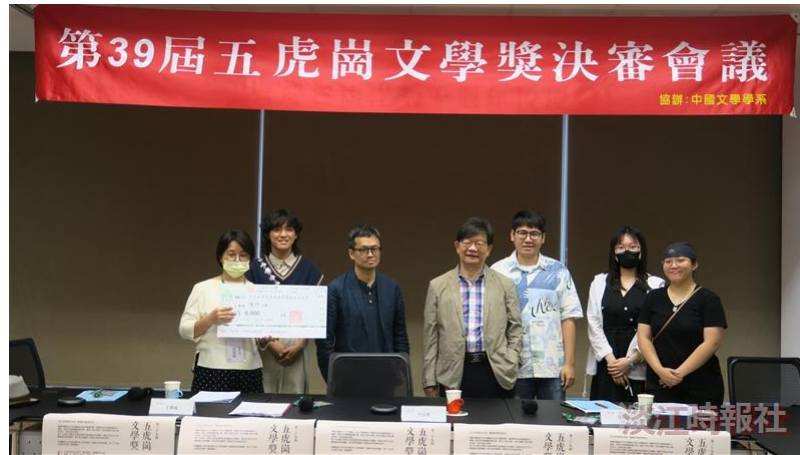
五虎崗文學獎散文組評審班給與得獎同學。