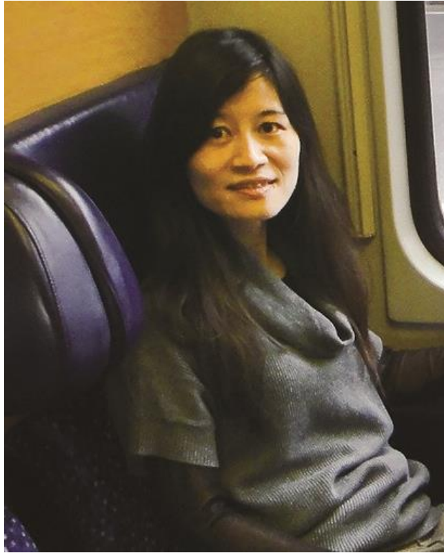
*同時入選2021年度科學影響力排行榜