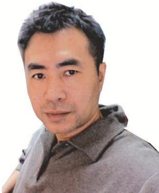
2022 「全球前2%頂尖科學家」學術生涯科學影響力排行榜 (1960-2021)

Artificial Intelligence & Image Processing / Industrial Engineering & Automation