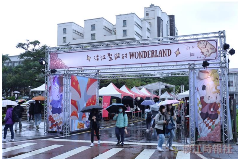
學生會於12月12日至16日在海報街舉辦「2022 Wonderland淡江聖誕村」，吸引不少人潮。