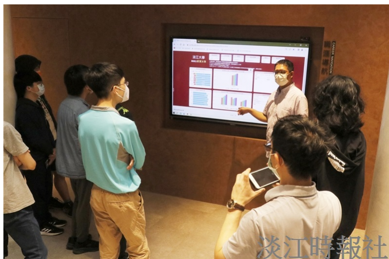
臺北市宸恩實驗教育機構到校參訪，學生於AI創智學院實境場域「職涯導航」區域，專心聽取本校畢業生相關資訊。