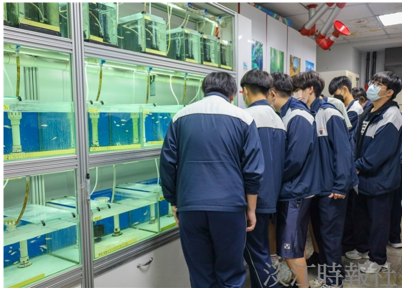
淡水商工高二、三學生近100名師生，到本校化學系參訪實驗室及實作。