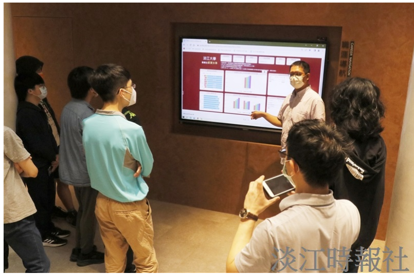
臺北市宸恩實驗教育機構到校參訪，學生於AI創智學院實境場域「職涯導航」區域，專心聽取本校畢業生相關資訊。