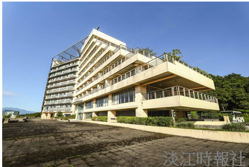
蘭陽校園遠眺太平洋，朝迎龜山日出，建築宏偉，氣象萬千。