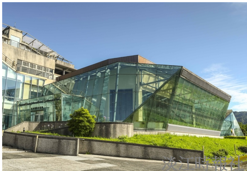
蘭陽校園遠眺太平洋，朝迎龜山日出，建築宏偉，氣象萬千。