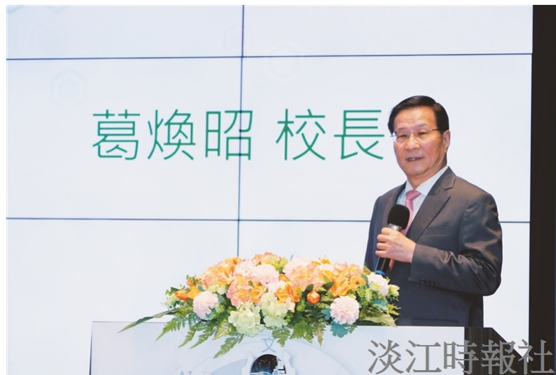
全面品質管理之產學創新與永續經營 葛煥昭校長開幕致詞