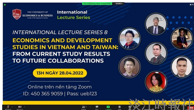
經濟系與越南河內國家大學經濟學院合辦線上研討會。