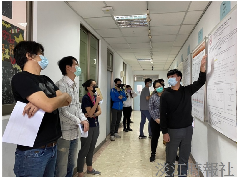
物理系舉辦物理週活動，同學以學術發表專題研究解說海報。