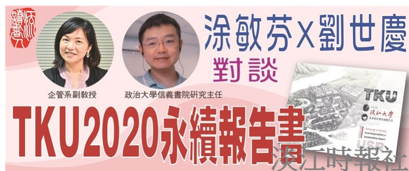
【一流讀書人對談】TKU2020社會責任與永續報告書