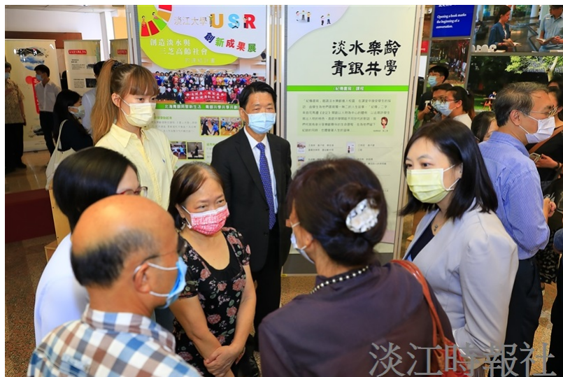
USR師生成果展於覺生紀念圖書館2樓學研創享區舉行，參觀來賓聆聽計畫成果說明。