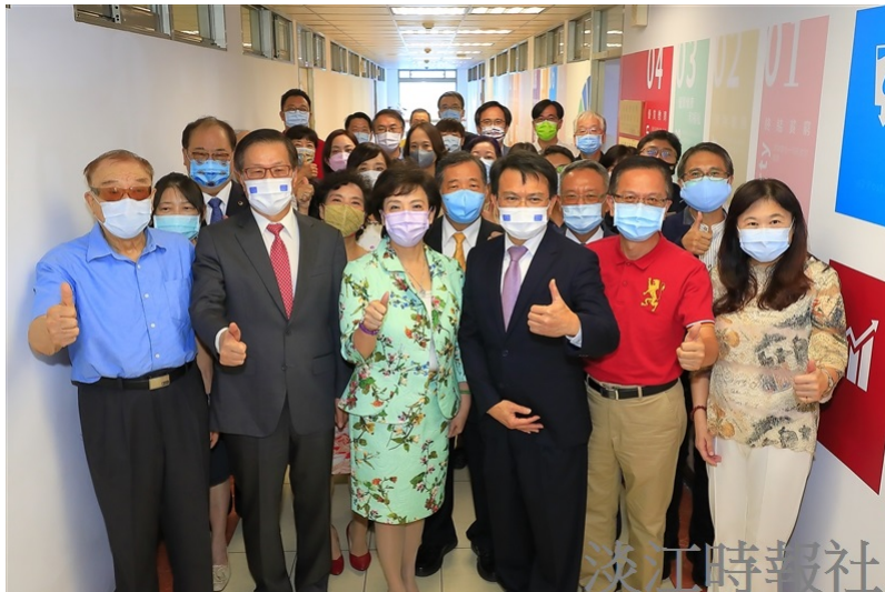
永續中心揭幕儀式後大合照。