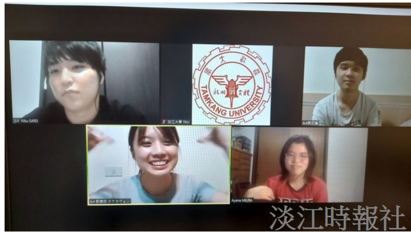
雙方學生開心進行小組交流。