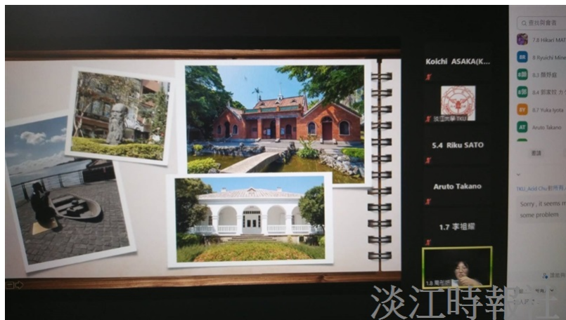
本校學生向對方學生介紹淡水觀光景點。