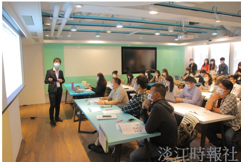
化學系論壇吸引全臺各大學百位同學參加口頭發表論文或壁報發表，彼此交流。