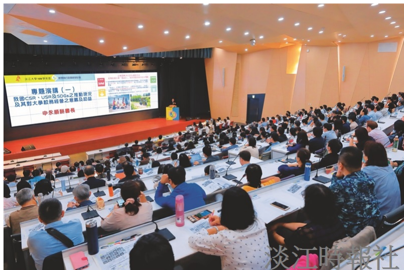
109學年度教學與行政革新研討會。