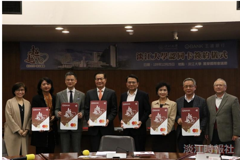
本校與王道銀行簽約發行「淡江認同卡」，每筆消費金額將回饋學校0.2%、持卡人0.8%現金。