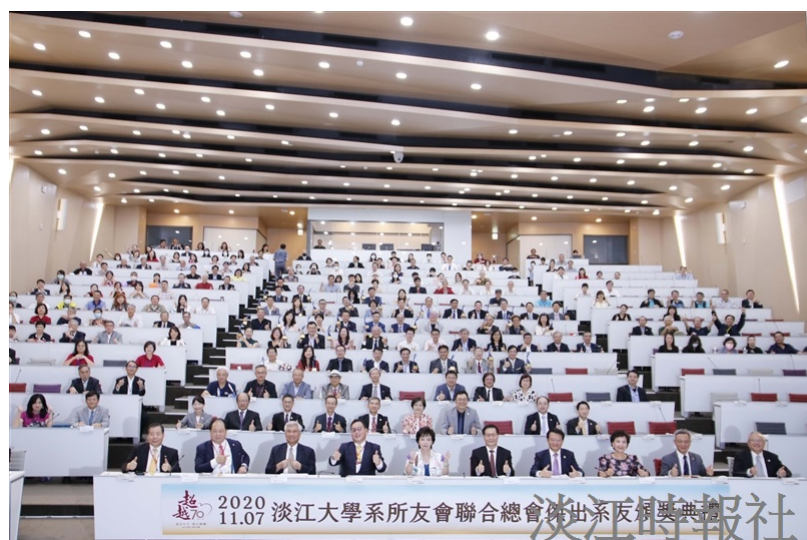
所友會聯合總會於11月7日在守謙國際會議中心有蓮廳舉辦「傑出系友頒獎典禮」，校友高朋滿座。