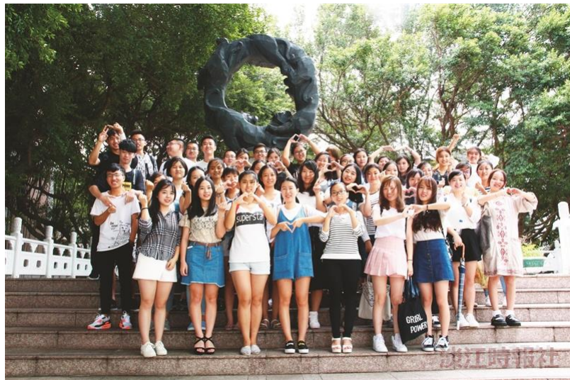
福建師範大學49位大三生來校參加文學院「文創學程閩台專班」，藉由課程內容和實習了解臺灣文創產業發展。

主編：吳秋霞、張濤 出版社：淡江大學出版中心 ISBN：9789869607193