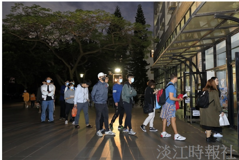
傍晚時分，依舊有學生準備進入工學大樓上課，配合學校措施、排隊量測體溫。