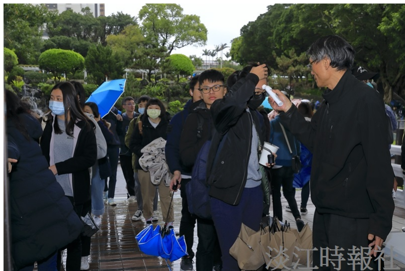
行政人員在商管大樓三樓大門前支援體溫量測。