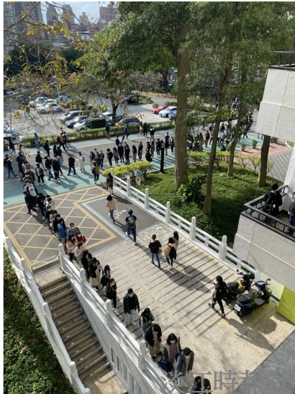
在上下課的尖峰時段，商管大樓二樓出入口也有排隊測體溫的人潮。