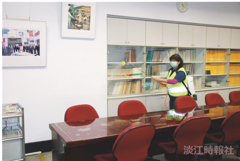
因應特殊傳染性肺炎，全校各場所積極進行消毒工作，提供師生開學後安心教學場所，圖為總務處以增購之大型噴霧機具對會議室進行消毒作業