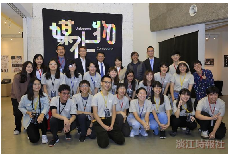
資傳系創意數位媒體教學實習招生暨成果展「媒化物」，熱鬧登場。

統計系同學於《機器學習》課程成果展分組報告中，現場解說海報內容。