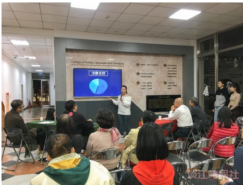
外語學院創新創業實習課程成果發表，修習學生團隊進行經驗分享。