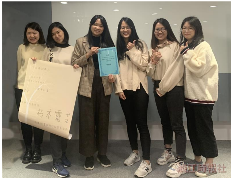
大傳系「社會行銷與實作」成果發表，「『花樣20』青藝盟募款與行銷策展活動」徵選，「朽木靈芝」團隊獲特優。