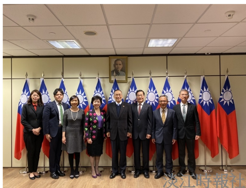
本校參訪團成員與西語系校友，駐西班牙大使劉德立於馬德里大學合影。