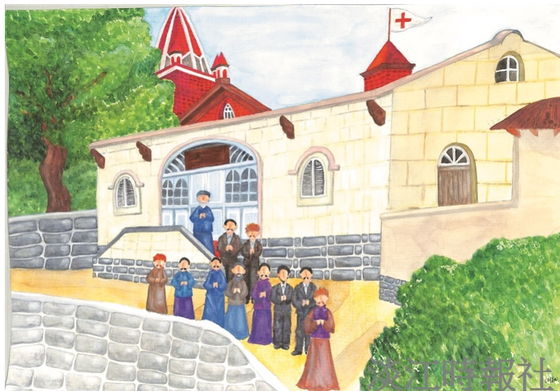
清法戰爭時期，滬尾偕醫館於戰爭中提供傷患醫療救治。