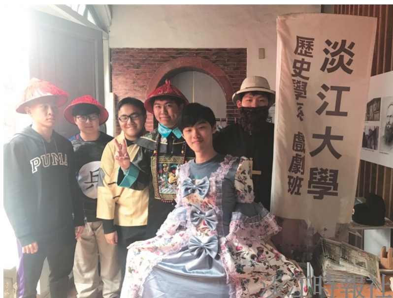
本校歷史系學生配合教育部USR與高教深耕計畫演出清法戰爭。