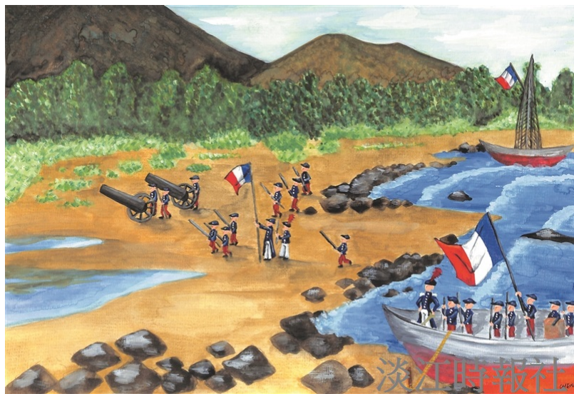
本圖為清法戰爭中法軍進攻滬尾示意圖。