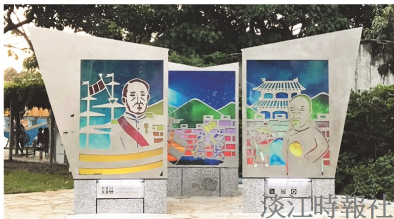
「清法戰役・滬尾時空再繪」裝置藝術以滬尾戰役為主軸，再現古戰場情境。