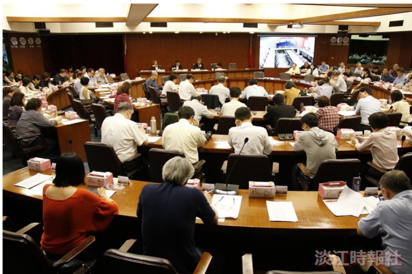
本校於5月17日下午2時10分在驚聲國際會議廳舉行107學年度第二學期教務會議，與蘭陽校園CL506會議室同步視訊，會