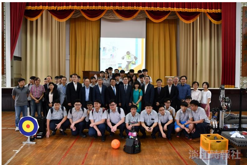
本校2019資訊週於5月22日在學生活動中心舉行，淡江高中師生也參觀資訊週，與校長葛煥昭等師長一起合影。