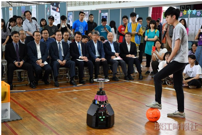
2019資訊週中，智慧自動化與機器人中心展示足球機器人的運球動作。