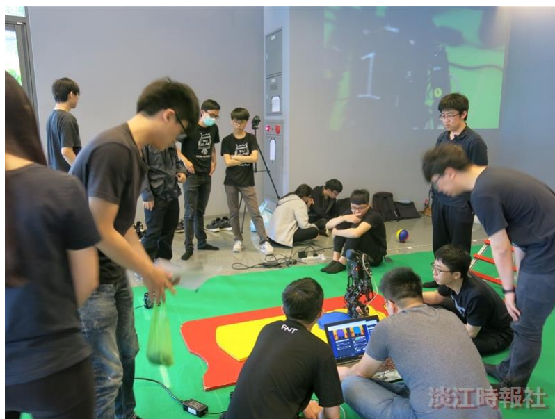
本校工學院於5月4日在守謙國際會議中心舉辦工學院系所聯合博覽會中，於守謙國際會議中心2樓進行機器人模擬賽展示。 。