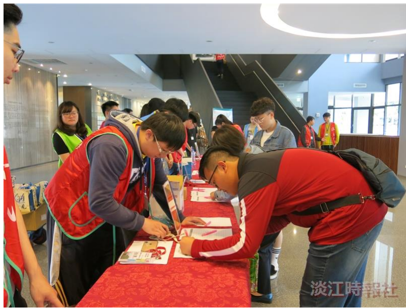
本校工學院於5月4日舉辦工學院系所聯合博覽會，新鮮人及家長們在守謙國際會議中心報到，了解工學院系所特色。