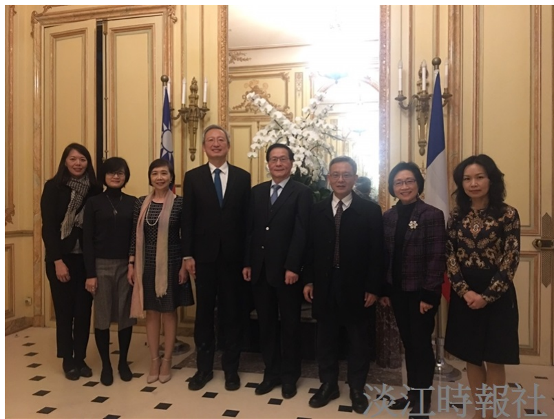
葛校長(右四)參訪團於3月11日受邀前往我國駐法代表處，由吳志中大使(左四)及外館人員接待。