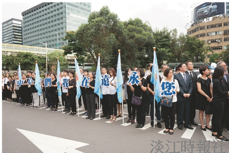
張創辦人告別式結束後，本校教職員生逾300人在廳外舉旗和排字感念他為校貢獻。