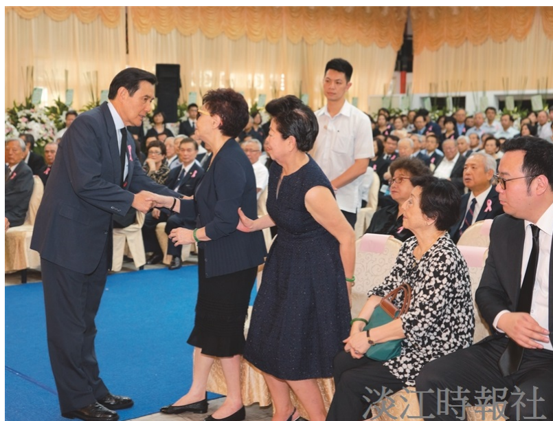
前總統馬英九（左一）出席張創辦人告別式致意，並向張創辦人家屬張姜榮譽董事長（左二）握手慰問。