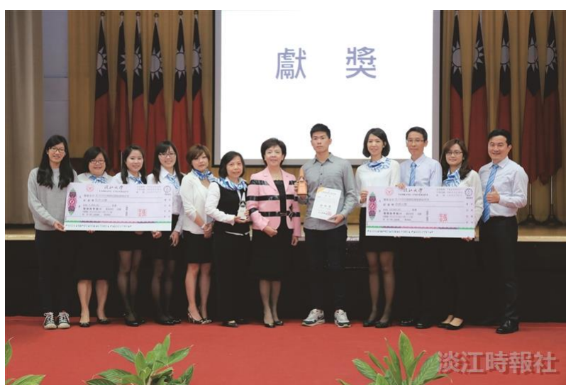
105學年度全面品質管理研習會特刊：獻獎—夢圈甜甜圈獲銀銅塔獎