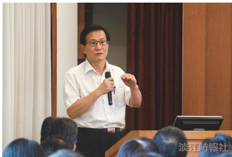
分組報告：第一組結論報告