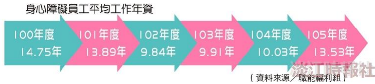
身心障礙員工平均工作年資。(資料來源/職能福利組)