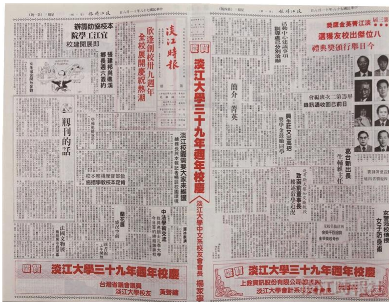
【學劃千期系列2】辦報求新求變 與時俱進