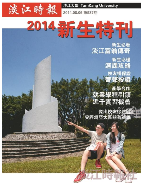
【擘劃千期系列2】辦報求新求變 與時俱進