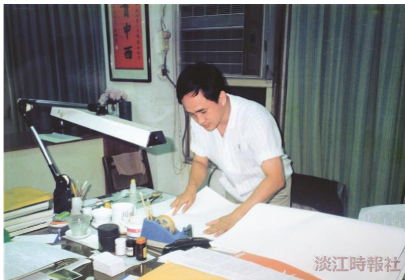
【擘劃千期系列2】辦報求新求變 與時俱進