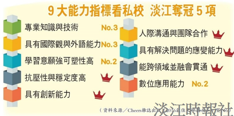
9 大能力指標看私校 淡江奪冠 5 項。（資料來源／Cheers雜誌出版《2016最佳大學指南》，頁146）