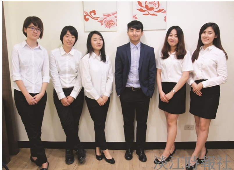
1111 人力銀行進行「2016 雇主最滿意大學調查」指出本校在「各產業雇主最滿意大學」中「金融投顧、保險相關」類別、「建築營造／不動產相關」類別皆排名全國第三，學生表現受肯定。