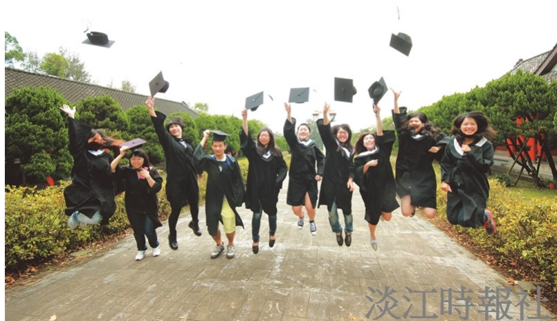
【企業最愛專刊】蟬聯19年 企業最愛私校