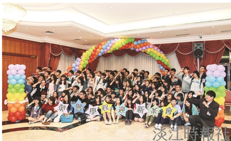
榮譽學程自 101 學年度開辦，旨在培養學生成為學術、知性及領袖人才，以增強畢業競爭力。（本報資料照）