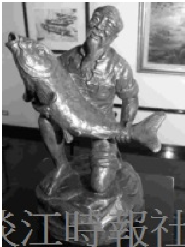
林木川以漁夫捕魚姿態所作的雕塑〈收穫〉。