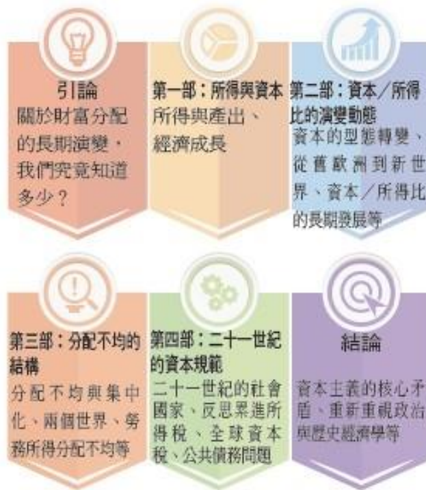
《二十一資本論》目錄