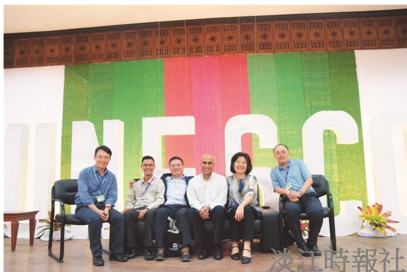
未來學所5位教師再度與UNESCO合作，在菲律賓擔任工作坊引導員，並與國際學者合影。