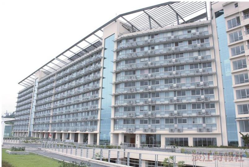
節能綠建築－響應環保，隨手關燈！