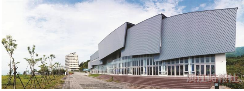
紹謨紀念活動中心—慢跑10圈，暢快流汗！