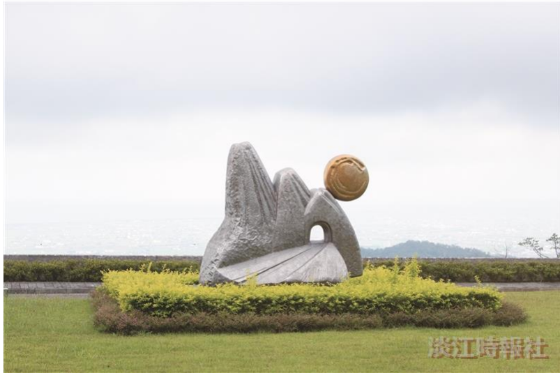
雪山隧道雕塑－與其他玩家繞雕像，玩「火車過山洞」遊戲。