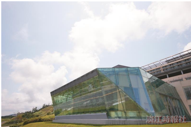
強邦國際會議廳－索取3位演講者的簽名！